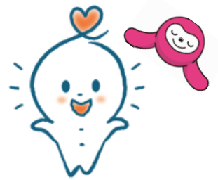
社協イメージキャラクター・ タッピーとたっすん